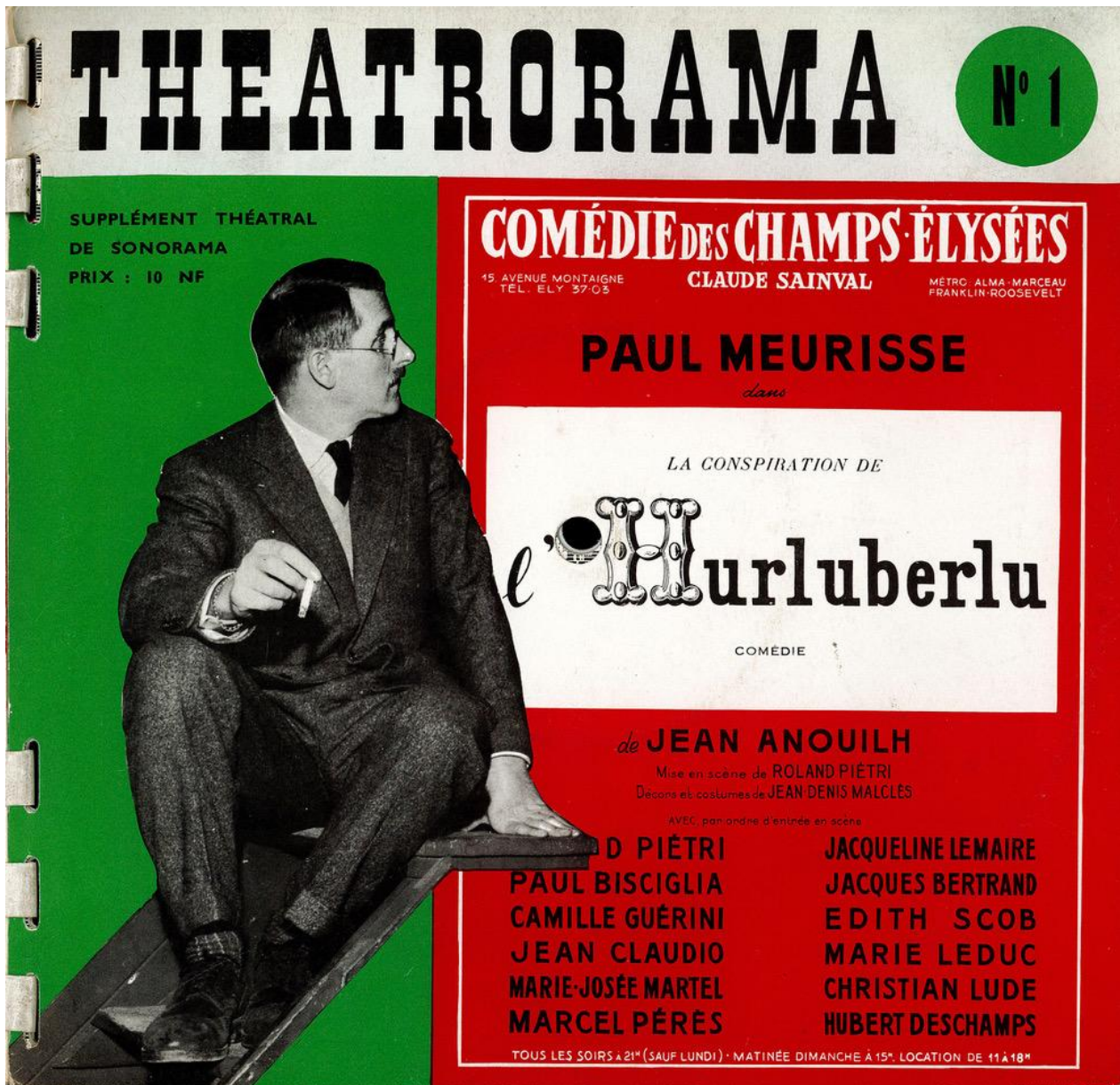
Fig.1 Théâtrorama , n° 1, La conspiration de l'Hurluberlu , de Jean Anouilh, supplément théâtral au n° 19 de Sonorama , Paris, Sonopresse, 1960. La couverture (Jean Anouilh et une représentation de l'affiche du spectacle). DR.