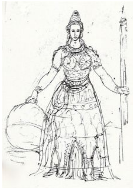
Figure II - J. Machereau, Le temple femme, dessin BA Ms 13910. D'après Antoine Picon, Les Saint-simoniens, raison, imaginaire et utopie , Paris, Belin, 2002.