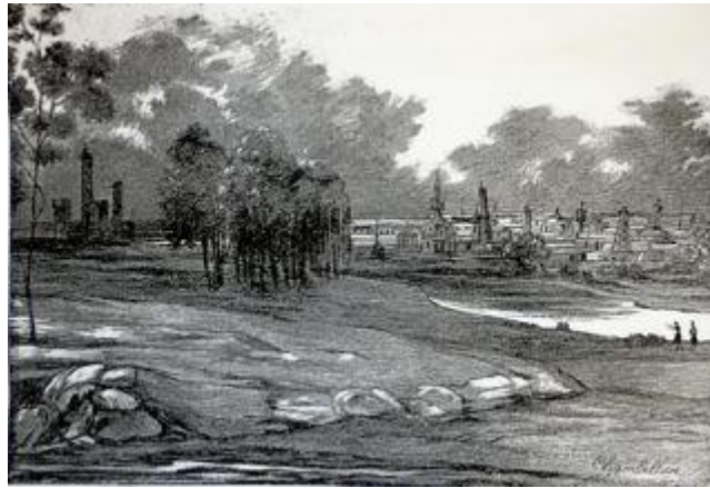
Figure I - La ville nouvelle de Saint-Simon, dessin de Chambellan, Le Charivari , 8 juin 1833.